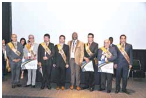
Personalidades galardonadas en este magno evento