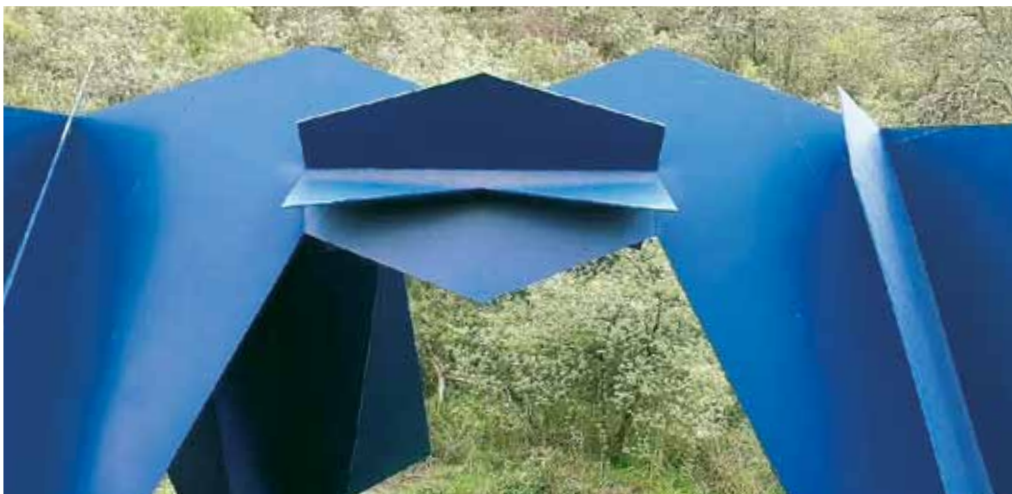
Detalle de Cólotl

Sebastián es el seudónimo de Enrique Carbajal, elegido porque cuando el joven estudiante que trabajaba durante toda la noche, por cuyo desvelo, se durmió en la clase de dibujo en la Escuela de San Carlos, al despertar el maestro lo señalaba y decía a los alumnos: “Ahora me dibujan a ese San Sebastián”; los amigos que nunca perdonan, a partir de ese momento lo llamaron Sebastián y eso, además de su capacidad artística indudable, le ha dado un toque importante en la memoria del arte internacional. El maestro es norteño, nació en la ciudad de Camargo, Chihuahua, el 16 de noviembre de 1947. Es decir, ya cumplió 70 años. Desde niño mostró habilidades para las artes