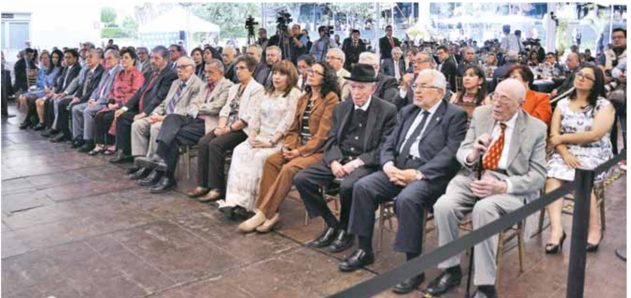
Los académicos galardonados escuchan atentos los mensajes dirigidos en la ceremonia en su honor