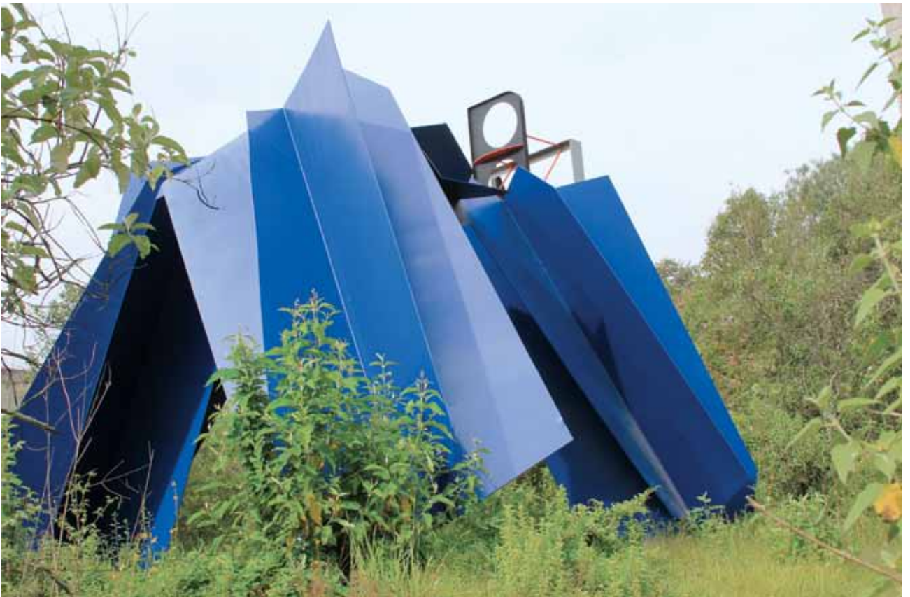
Cólotl en perspectiva

Sebastián ha trabajado la pintura; obra gráfica; grabados y sobre todo, esculturas. Poco se conoce que tiene diseños de joyas, muebles, juguetes, monedas y otros objetos. Sus esculturas monumentales las encontramos en ciudades como Denver, Dallas, Kioto, Kanasawa, Vancouver, Chihuahua, Monterrey, Villahermosa y Ciudad de México, especialmente en Ciudad Universitaria, donde se pueden observar: Casa de la libertad , Camino de la justicia hacia el siglo XXI y Garra de jaguar , en homenaje a Rufino Tamayo.