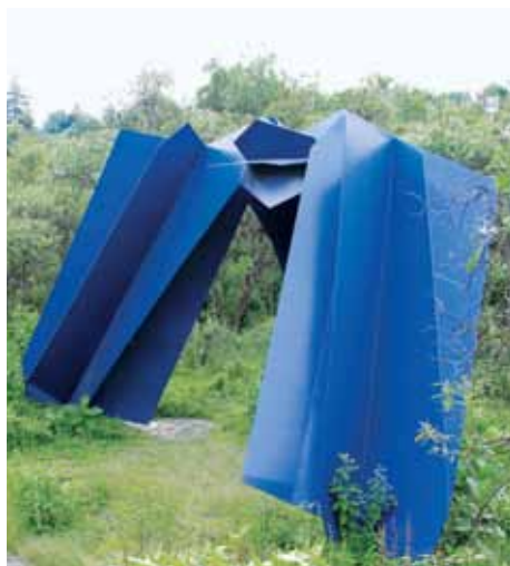
PORTADA: CÓLOTL "EL CAMINO DEL ESPACIO ESCULTÓRICO"